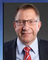
Jörg Bergmann Vier Gas Transport GmbH Open Grid Europe GmbH