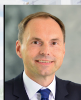
Dr. Jens Sprotte Alstrom AG