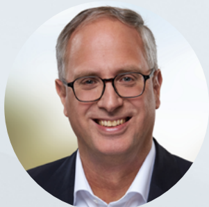
Tobias Koch MdL