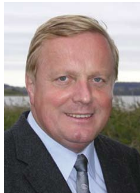
Fraktionsvorsitzender Dr. Johann Wadepuhl und Werner Kalinka, Vorsitzender des Innen- und Rechtsausschusses, stellten die Positionen der Fraktion der Presse vor.

Im Vordergrund müssen die Bedürfnisse der Menschen stehen. Notwendig ist daher eine ortsnahe und qualitativ hochwertige Versorgung mit Einrichtungen der Daseinsvorsorge sowie mit Bildungseinrichtungen. Die Förderung des ländlichen Raums darf nicht abgebaut werden.